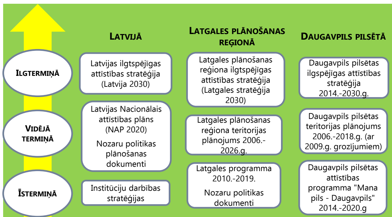
Attēls:1 Attīstības plānošanas dokumentu hierarhija

Dažādu līmeņu teritorijas attīstības plānošanas dokumentu hierarhiju un saskaņotību skatīt 1.attēlā.